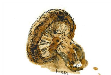
No.26 「椎茸のコーヒー画」