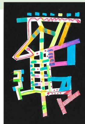
No.14 「コレクションテープ アート」