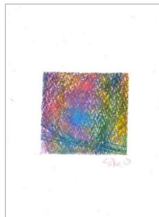
No.2 「ポストカード・美しい色面」