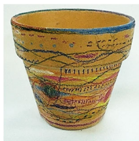
No.4 「植木鉢に描く 線のアナログ画」