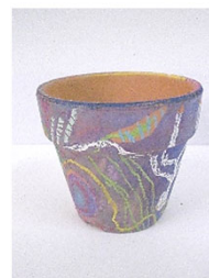
No.6 「木鉢に描く 地中のアナログ画」