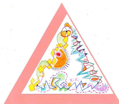
No.20「くるくる回して描く三角形」